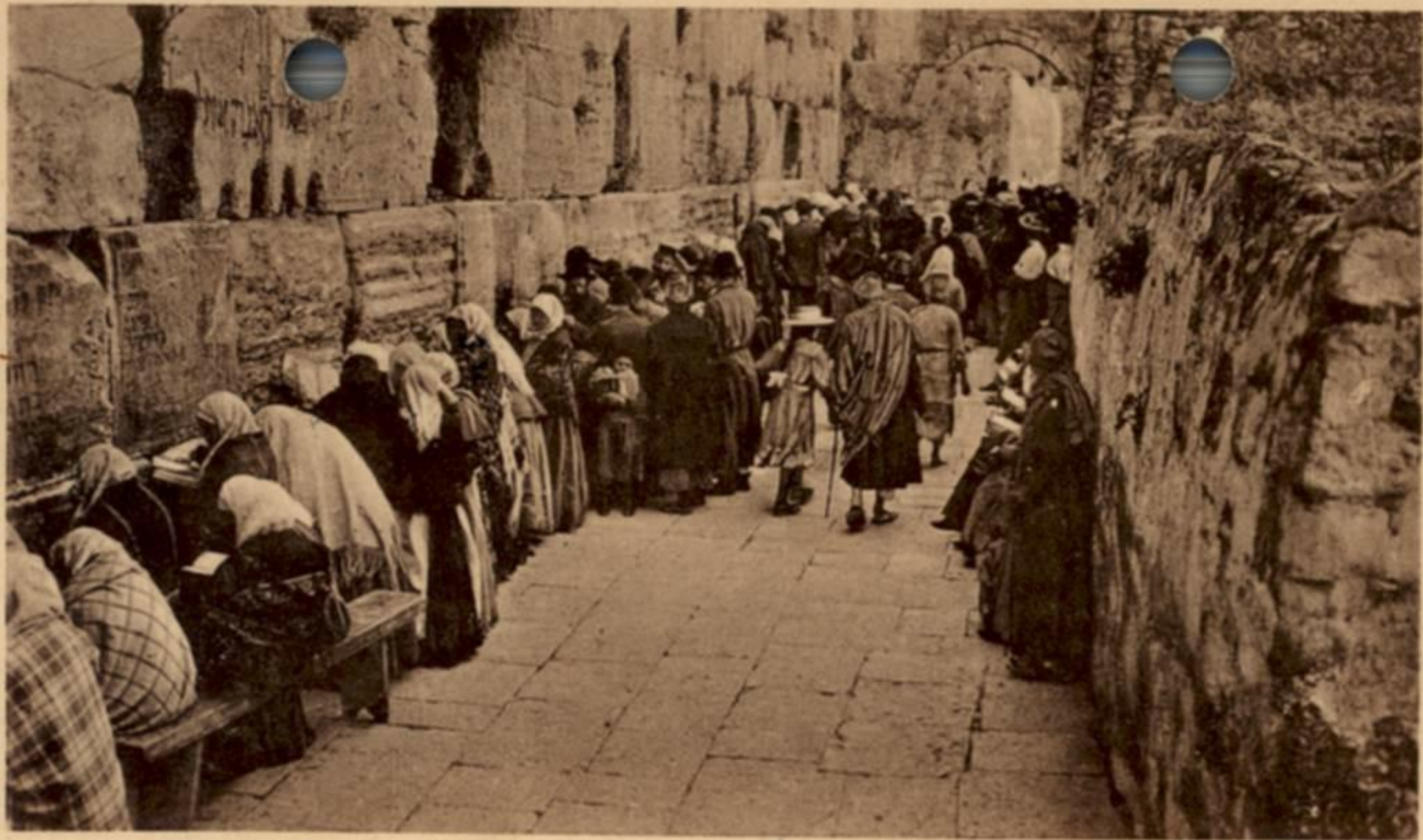
JERUSALEM, THE WAIL-WALL.