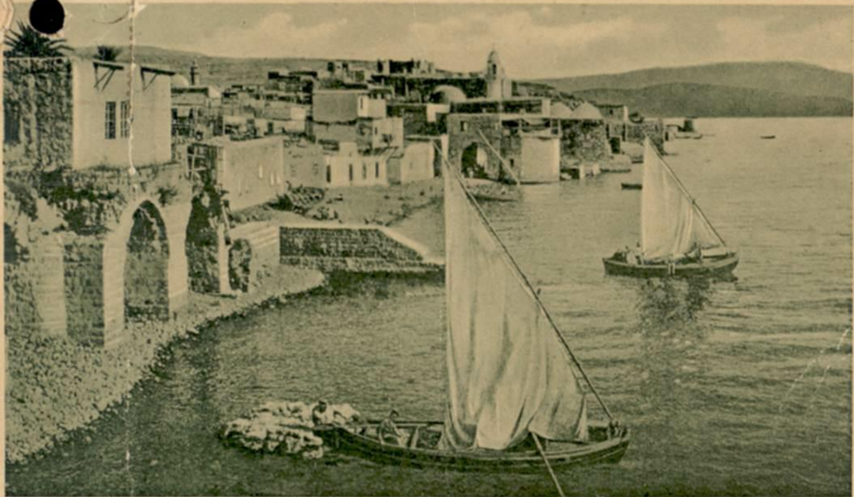
TIBERIAS - PANORAMIC VIEW.