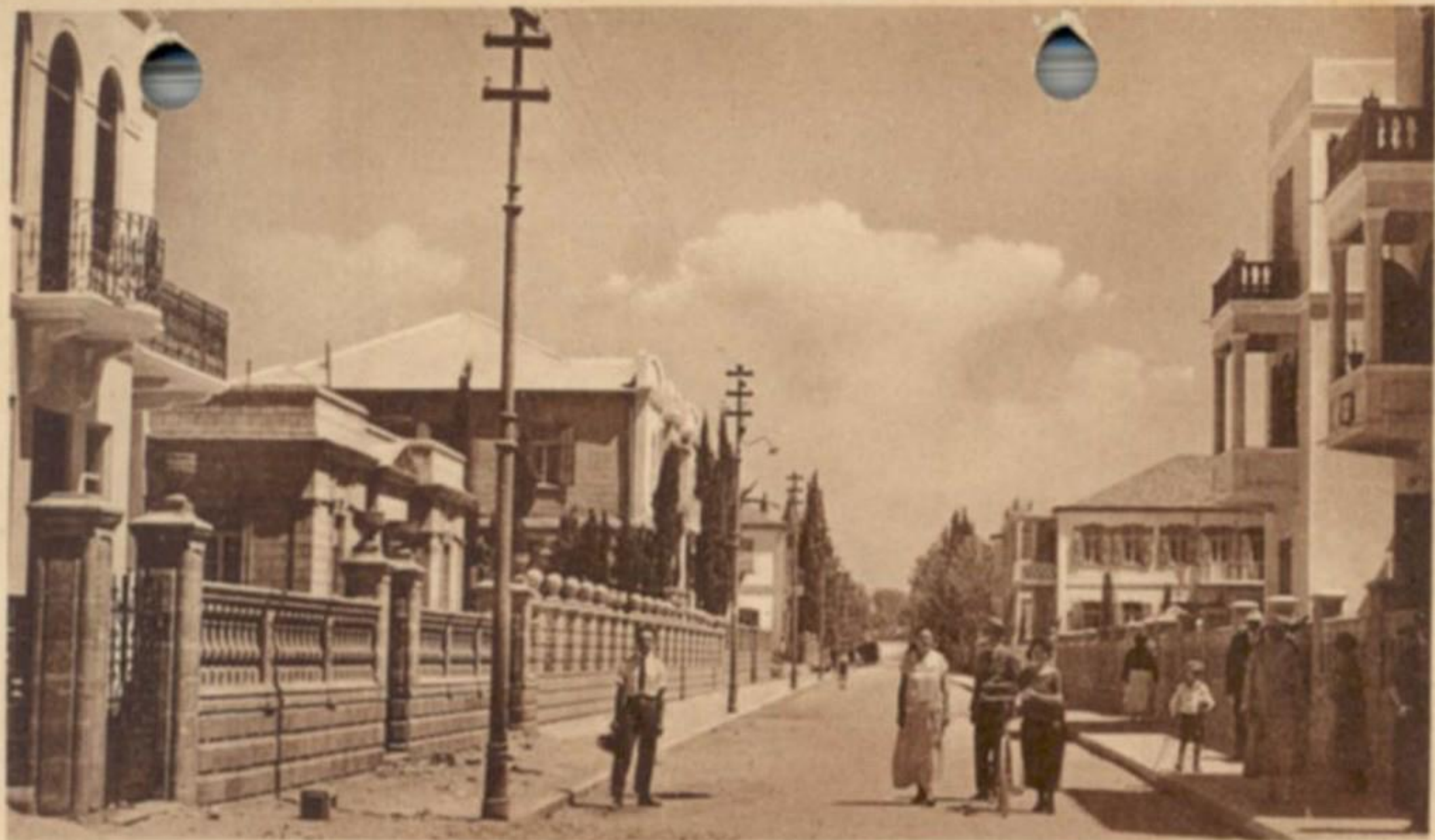
TEL-AVIV, YEHUDA HALEVY STREET.