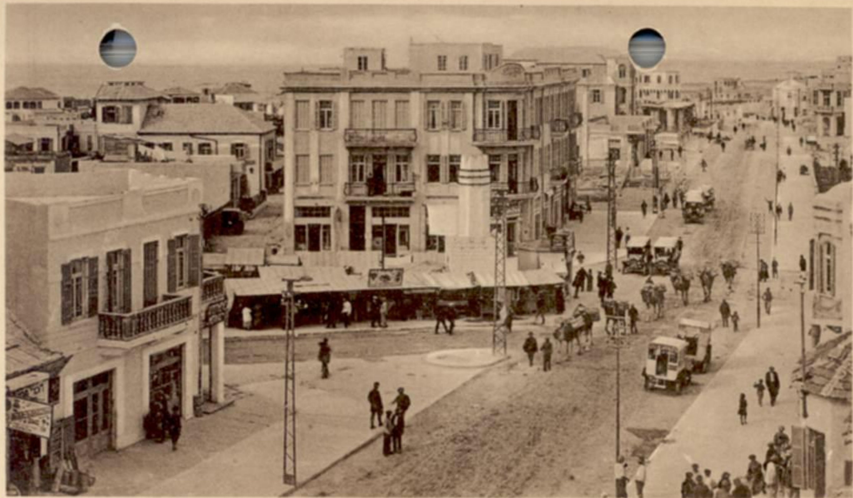
TEL-AVIV, ALENBY ST.