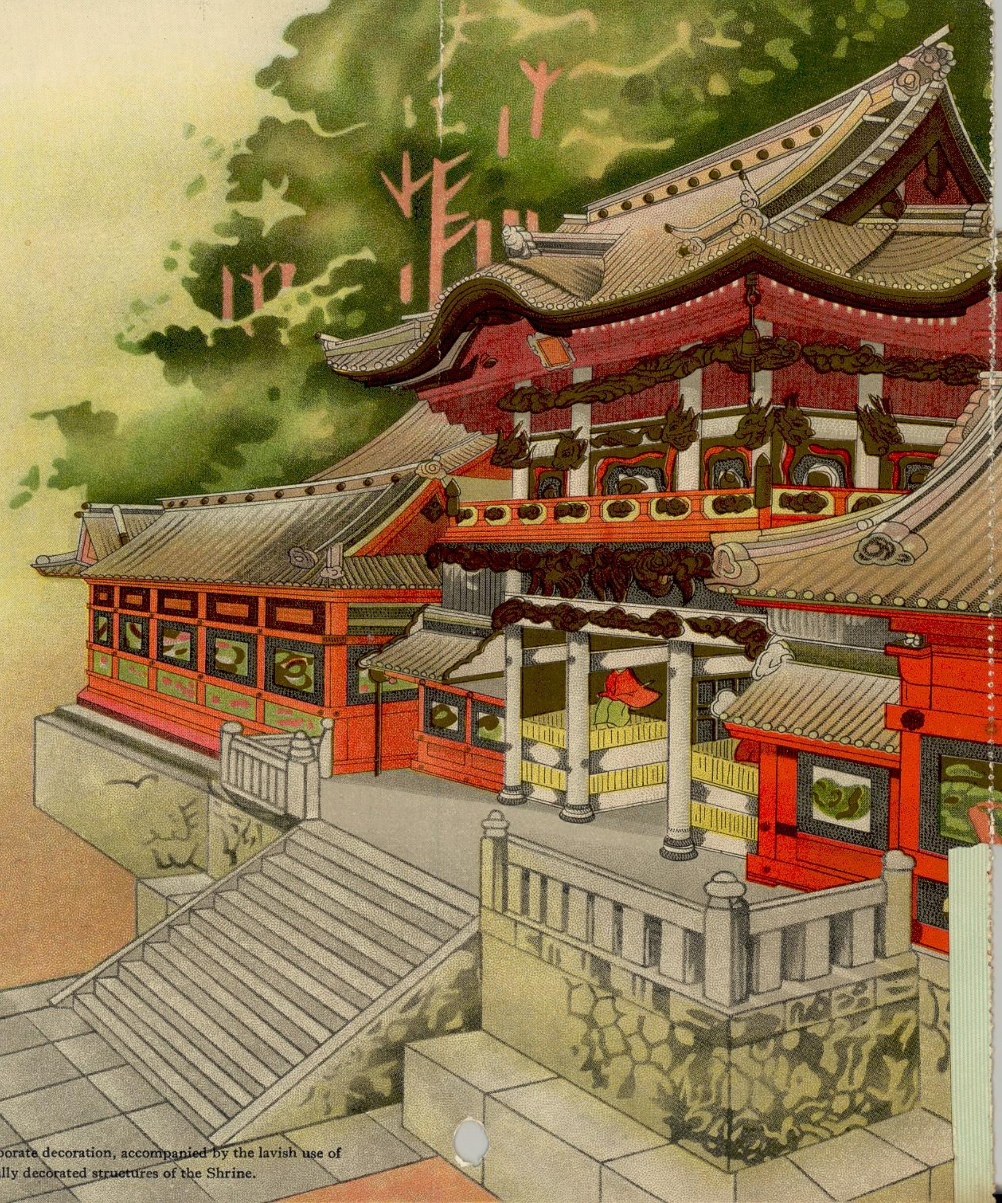
A magnificent gateway to the Toshogu Shrine at Nikko. With its profuse elaborate decoration, accompanied by the lavish use of gold, the gate stands out prominently even amongst the many beautifully decorated structures of the Shrine.

( EXTRA Japanese Dish ) Ika no Umani Negima